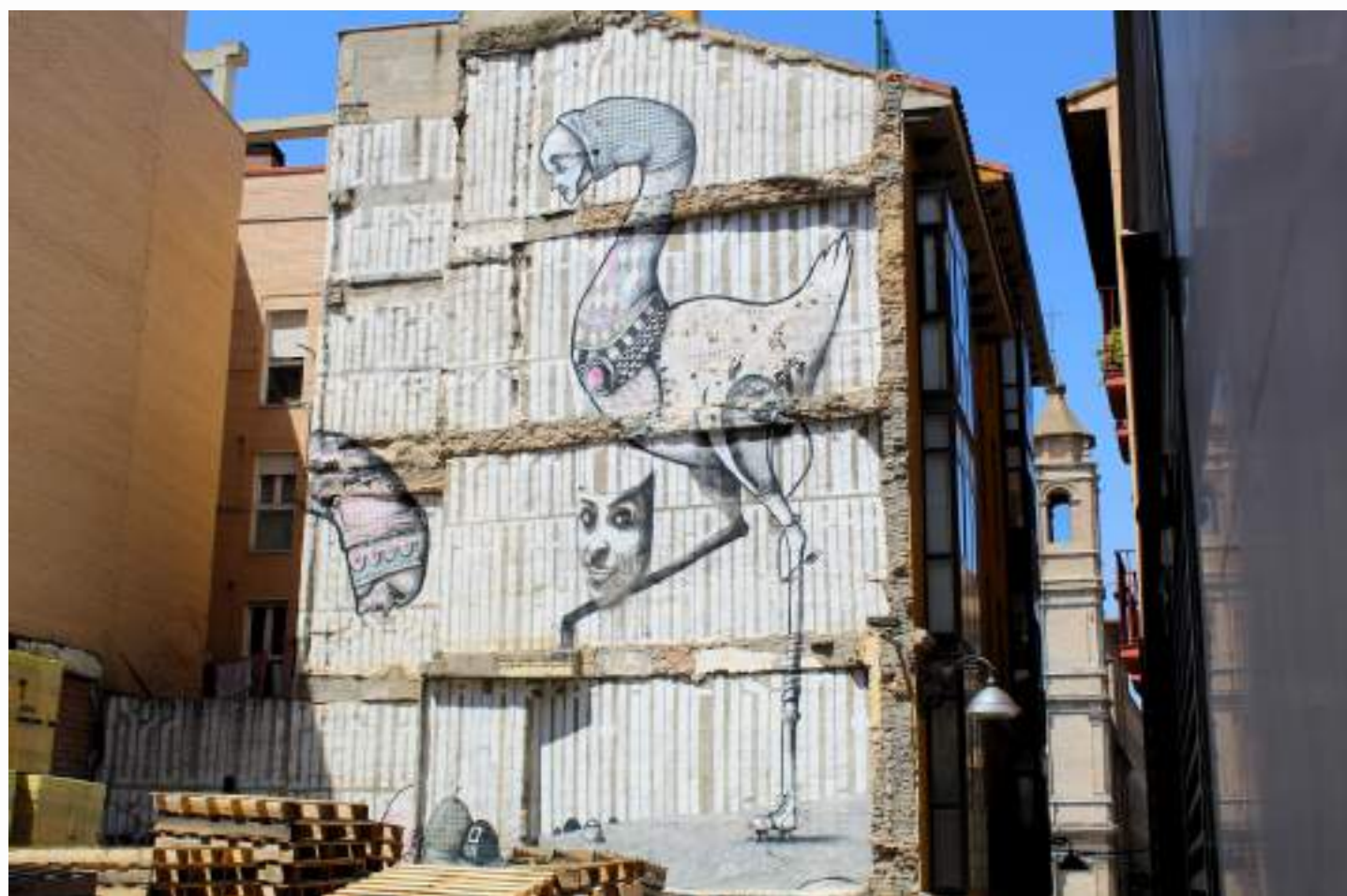
Mural de CNFS+ y Malakkai que combina una cabeza humana con un cuerpo de ave tipo avestruz y elementos tecnológicos, simbolizando la fusión entre lo natural y lo digital. Asalto 2010