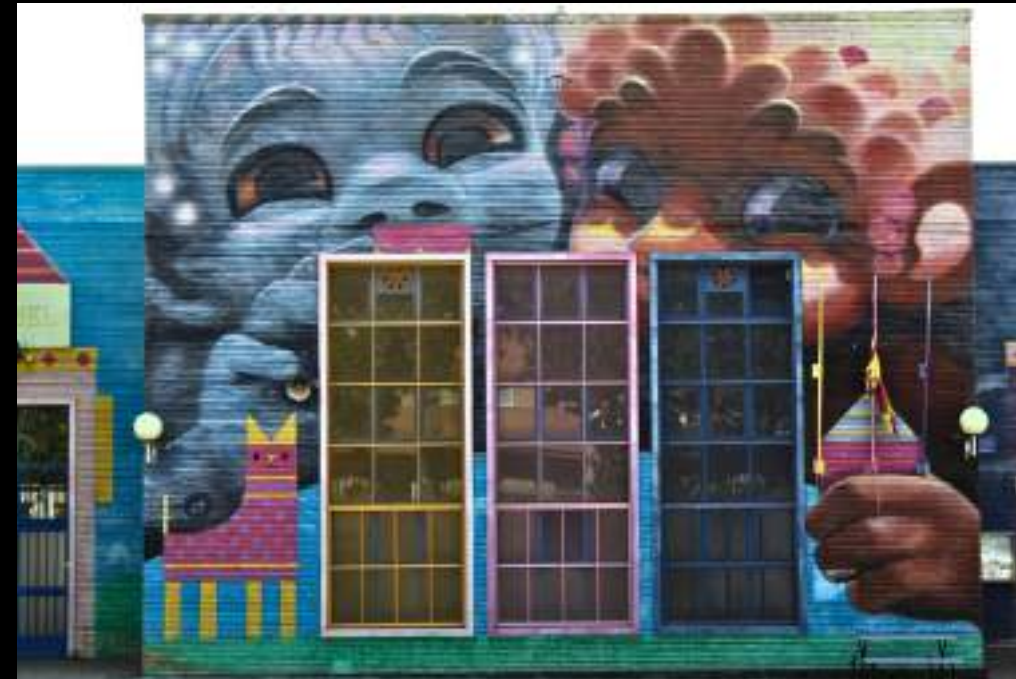
Animalitoland destaca con un mural colorido, fruto del proyecto "Design for Change" y las creativas propuestas de los niños y niñas.