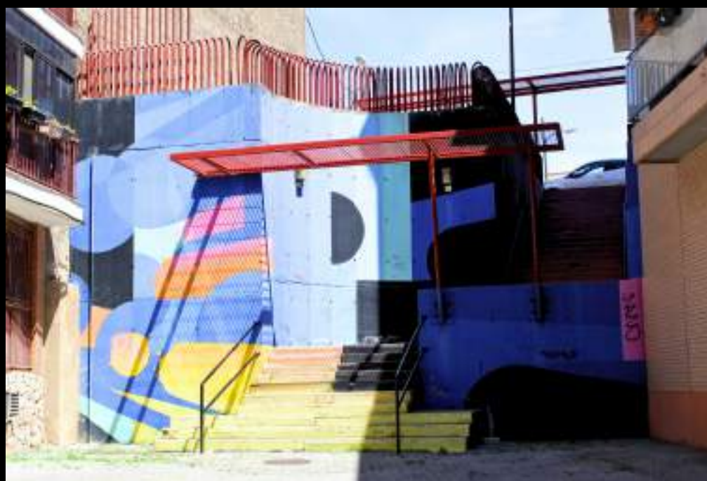
El francés Zest pintó sobre una escalera en el barrio de Valdefierro, ofreciendo perspectivas coloristas con su estilo abstracto. Asalto 2017