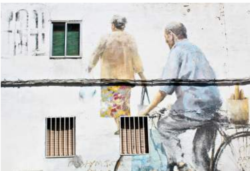
Udatxo plasma el movimiento de dos vecinos del barrio en su obra.