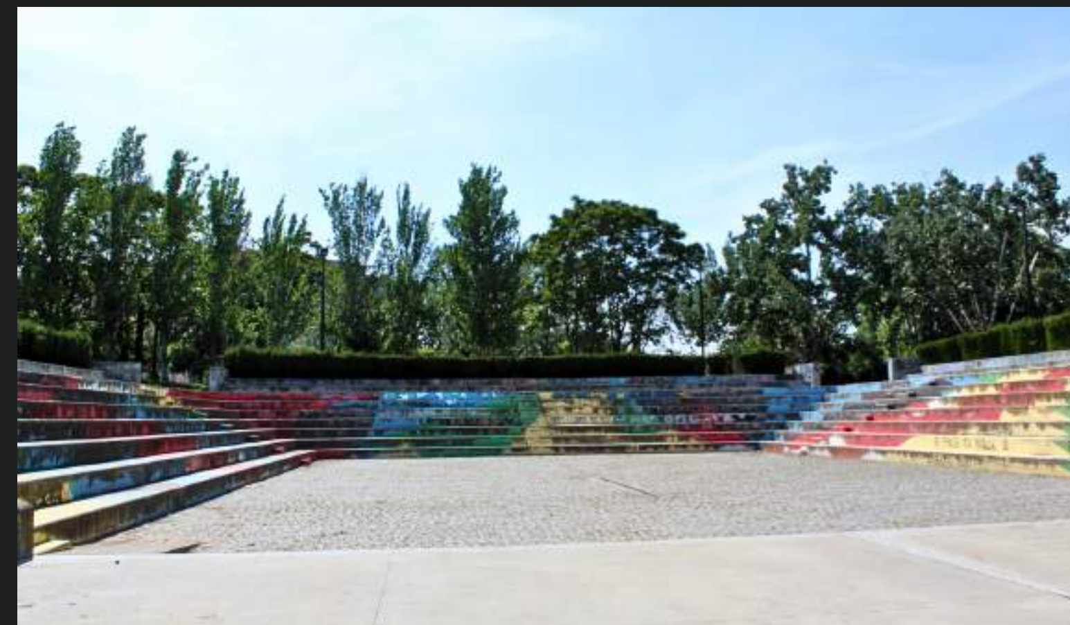
El artista argentino Elian participó en el undécimo Festival Asalto con un mural en el Parque Delicias de Zaragoza, donde su característico uso de la abstracción y el color establece un diálogo con el entorno urbano.