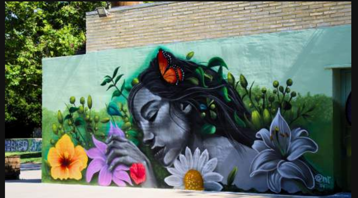
HIBEN, Parque de Delicias