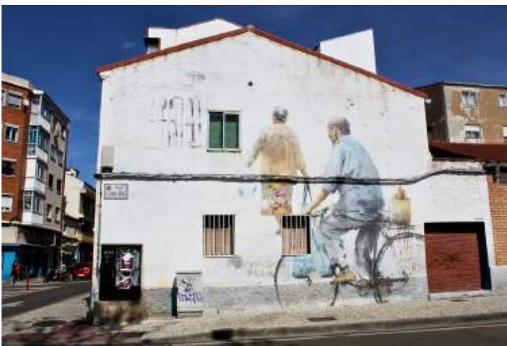
Para Udatxo, la calle es el espacio donde sus obras cobran vida. Asalto 2018