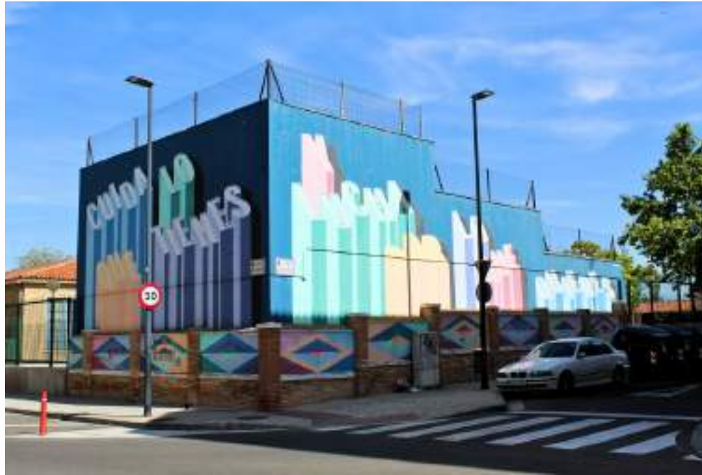
Durante el Asalto 2018, el dúo Half Studio creó un mural caracterizado por letras volumétricas y colores vibrantes.