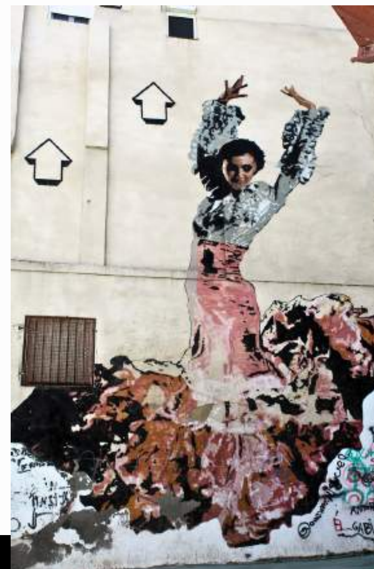
Flamenco, mural de Above realizado en el Casco Viejo de Zaragoza durante el séptimo Festival Asalto, expresa la esencia del flamenco a través de la figura de una bailaora.