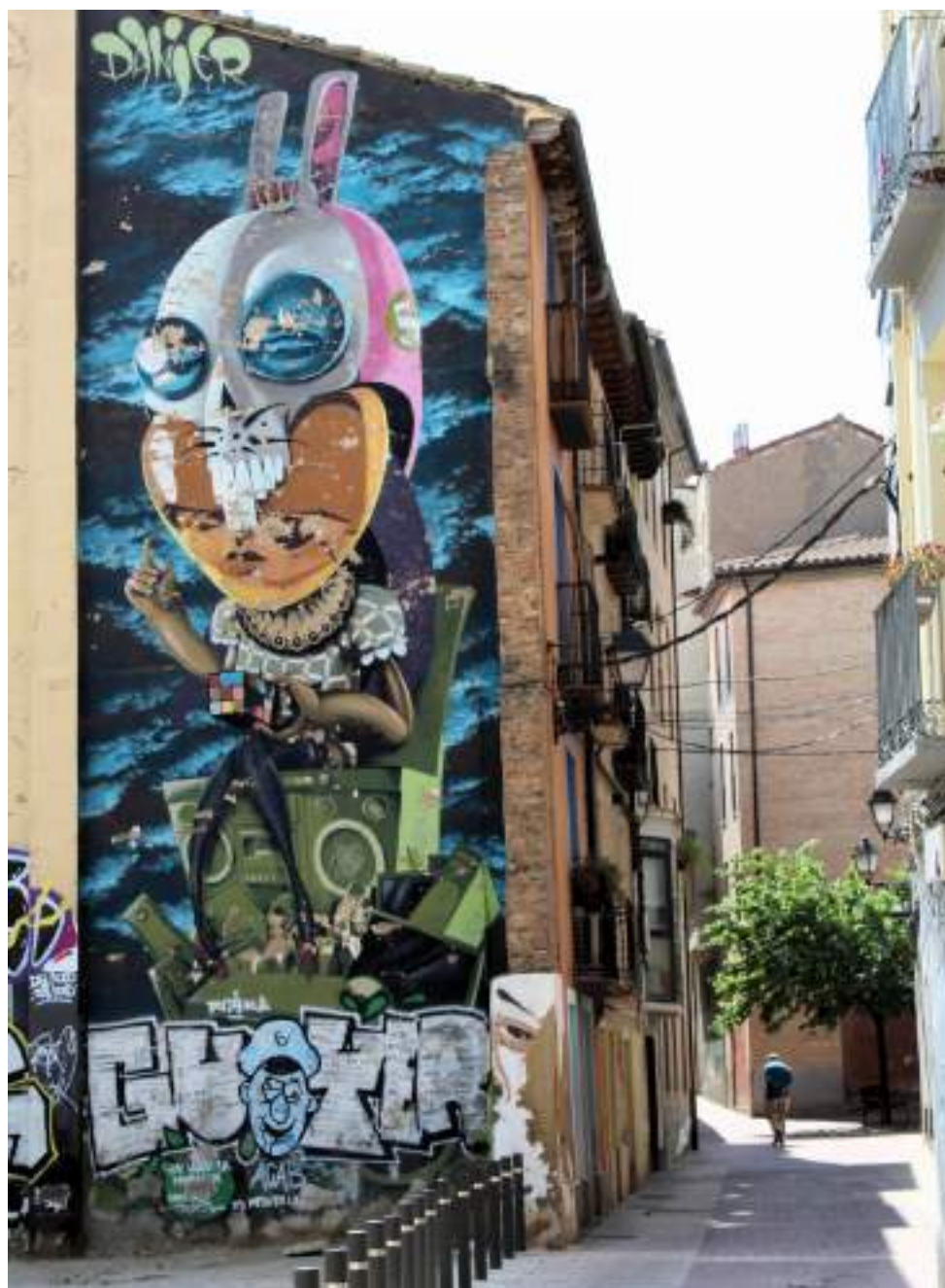
Mural surrealista de Danjer en el Casco Viejo de Zaragoza, creado en el Festival Asalto 2010, con guiños a la cultura pop y la tecnología.