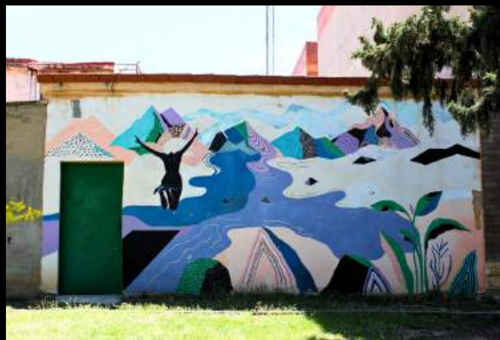
La obra de R. Zarza rinde homenaje a las mujeres de Valdefierro que lucharon por el acceso al agua corriente en el barrio. Asalto 2017