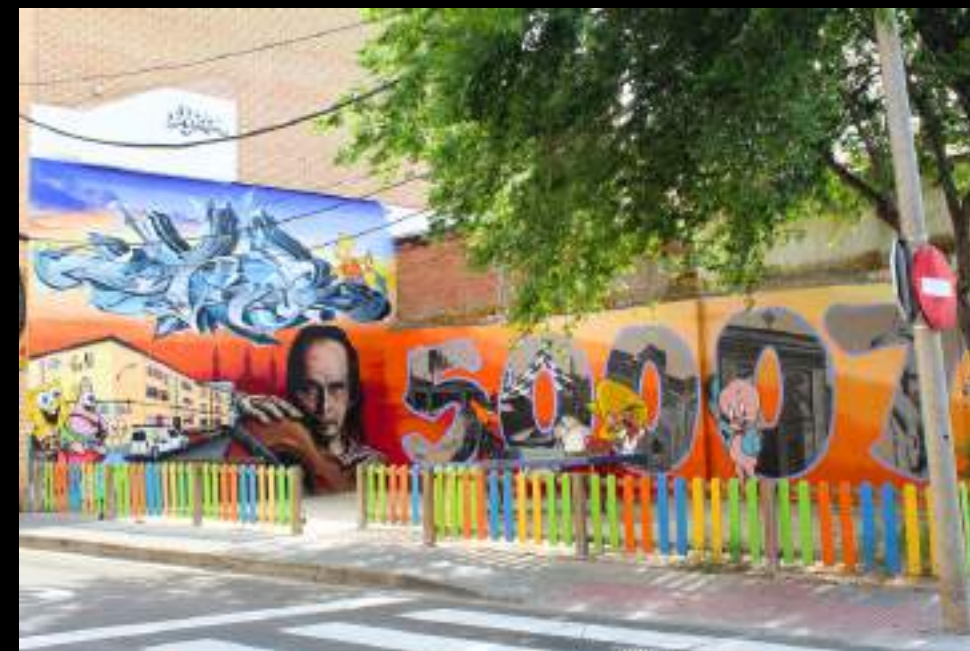
Barok rinde homenaje a Paco de Lucía con su guitarra y representa a varios personajes ficticios en su obra. Asalto 2024