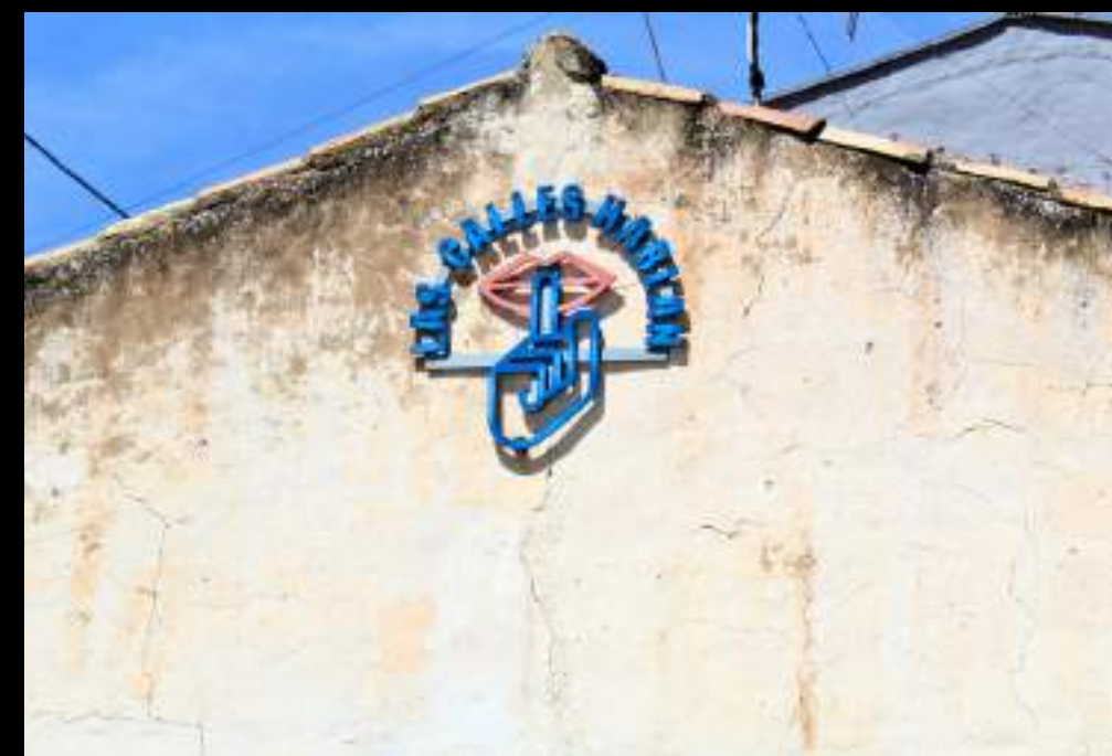
Maestro Cerezo invita a reflexionar sobre la vida y el arte en la ciudad, mostrando cómo los espacios pueden contar historias. Asalto 2017