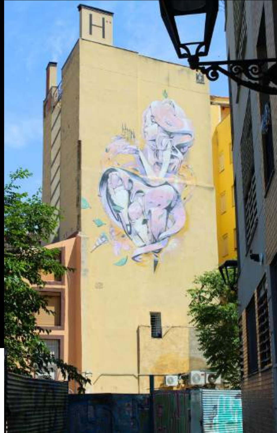
La Madonna del Viento, de Isaac Mahow, personifica al cierzo como diosa envuelta en un caudal que alude al río, símbolos esenciales de Zaragoza. Asalto 2013