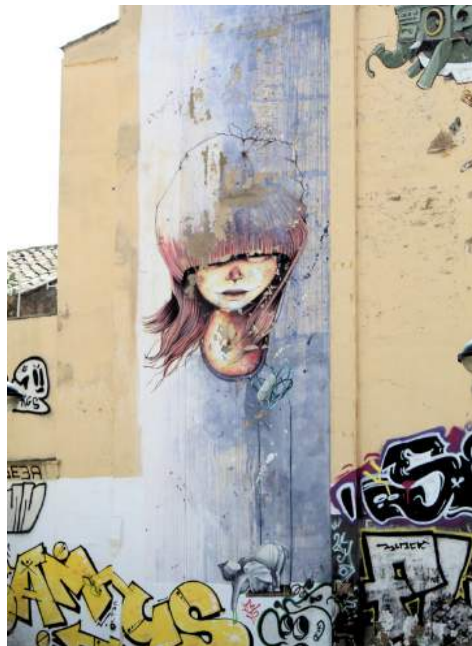
Mural de Chikita en el Casco Viejo de Zaragoza, realizado durante el Quinto Asalto del Festival Asalto, con una figura femenina de estilo onírico y elementos surrealistas.