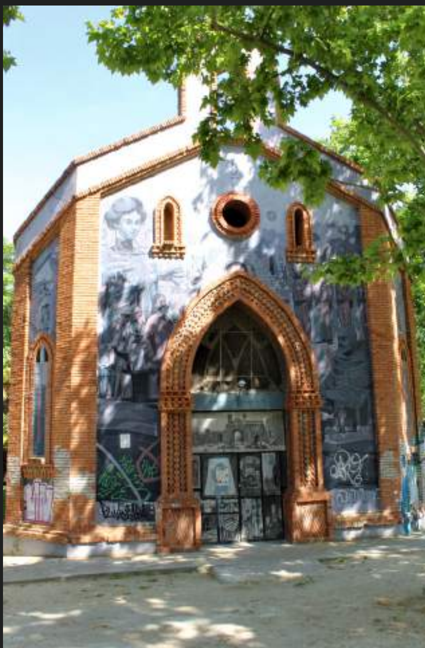
Mural de Aryz y SAN en una antigua capilla de Las Delicias, Zaragoza, que fusiona motivos clásicos con arte contemporáneo. Asalto 2016