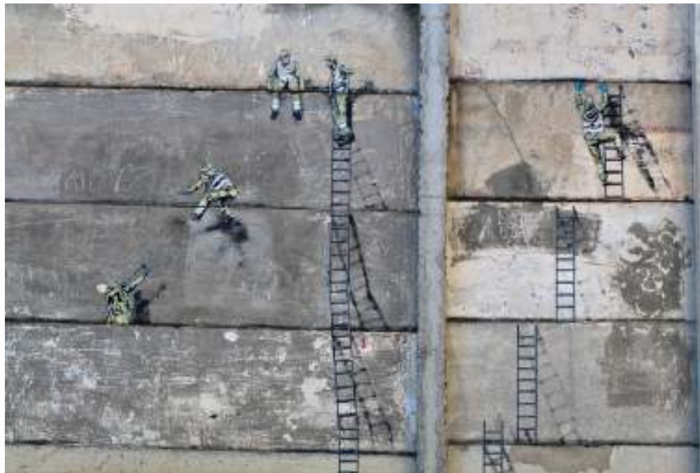
Jaune Art presenta un mural que denuncia la invisibilidad diaria de los trabajadores de mantenimiento, construcción y limpieza en las grandes ciudades. Asalto 2018