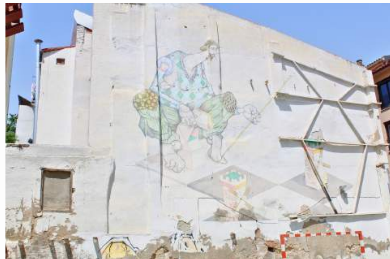
El mural Don Kichote, obra de Sepeusz & Chazme, representa al emblemático personaje creado por Miguel de Cervantes, protagonista de la primera novela moderna y uno de los grandes hitos de la literatura mundial. Asalto 2011