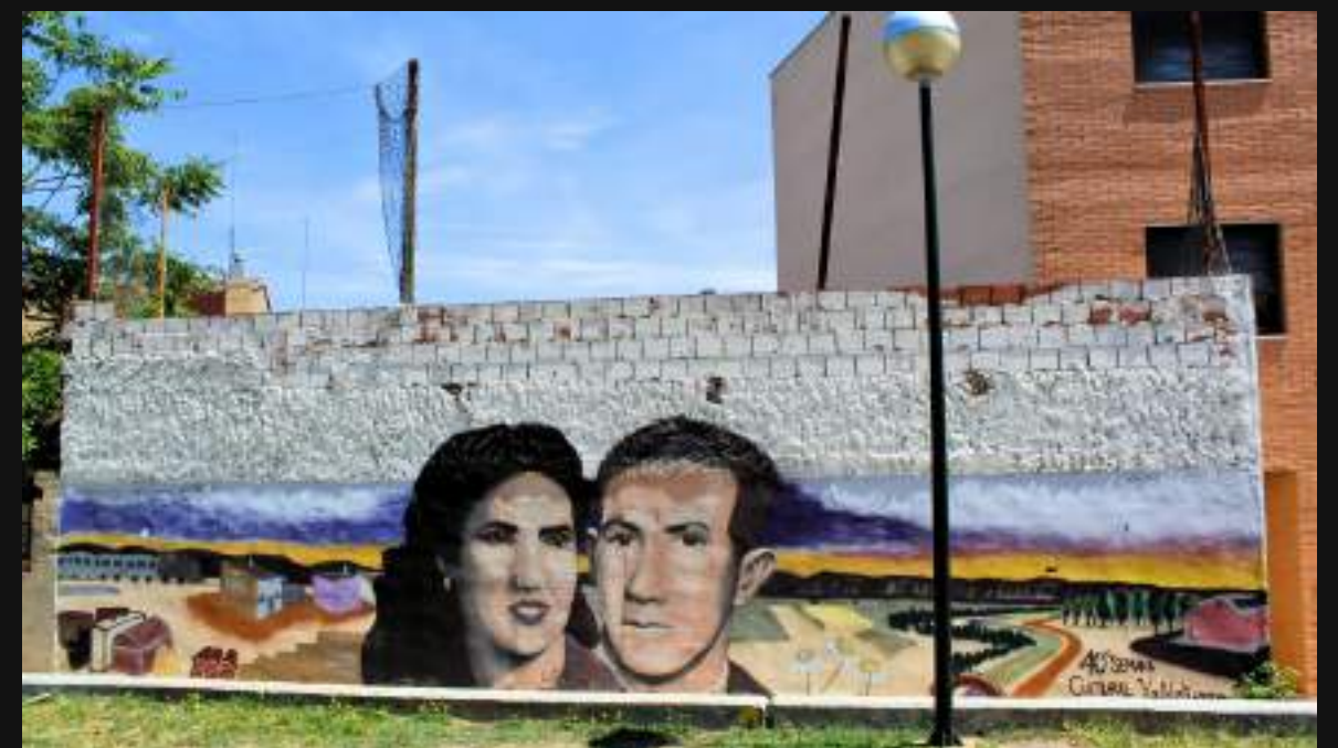
NADA MÁS JULIA, Barrio de Valdefierro