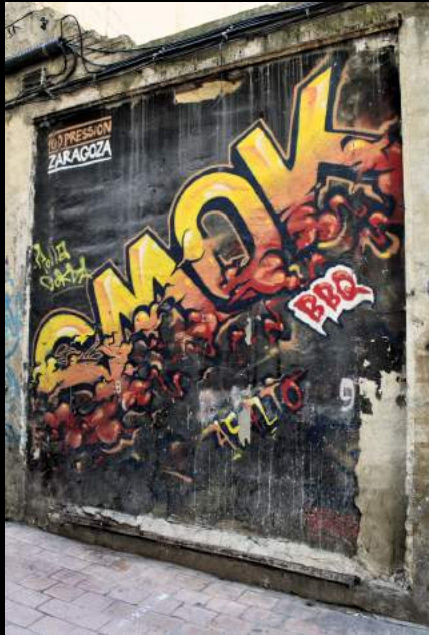
El colectivo francés 100 Pression presenta en Zaragoza un mural con la palabra "smok" en una composición provocadora. Asalto 2010