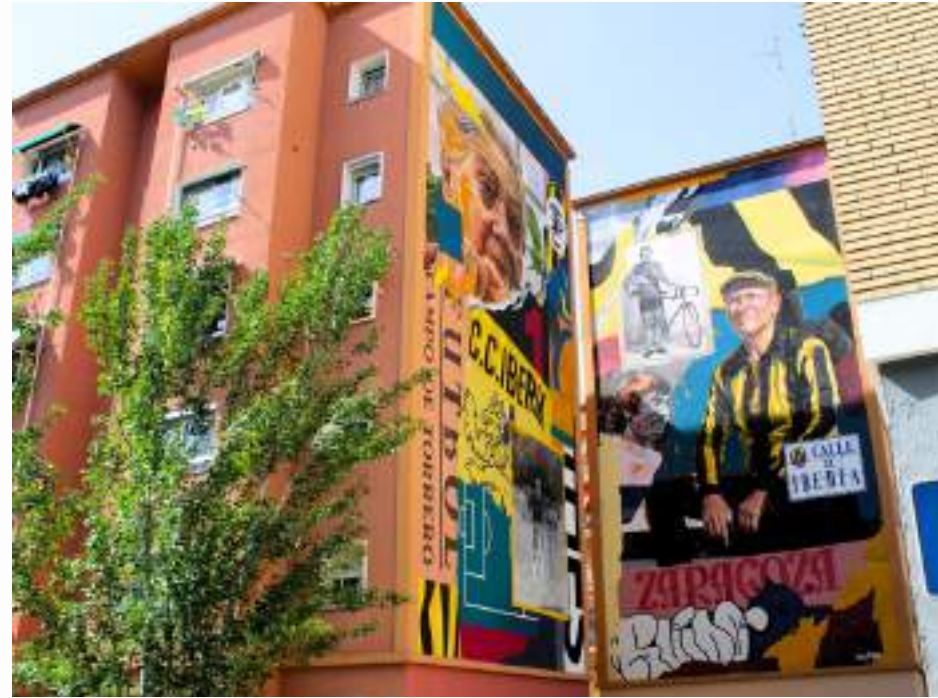
Draw y Alma (Proyecto Ruído) homenajearon en 2024 la identidad de Torrero y su antiguo campo de fútbol con dos murales.