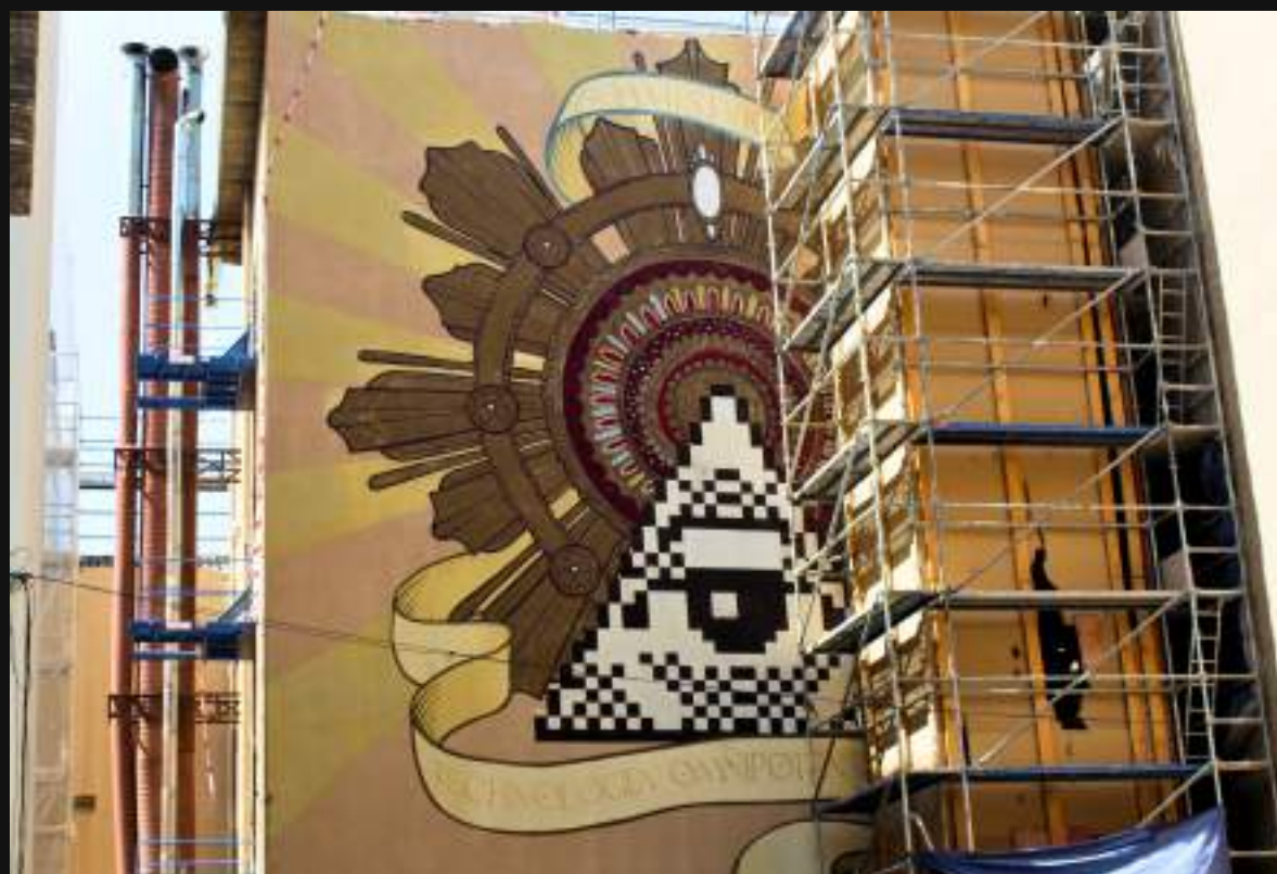
BOA MISTURA, Centro de Zaragoza, Asalto 2010