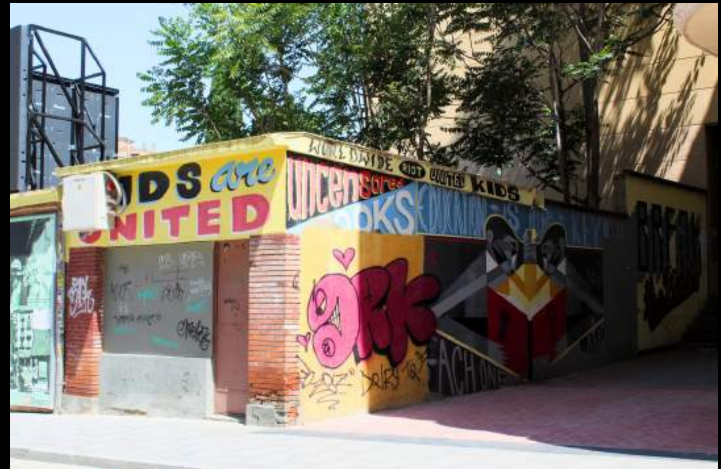
El colectivo francés 100 Pression firmó un mural que destaca por sus pinceladas audaces y su fusión de gráfica publicitaria con mensajes directos. Asalto 2010